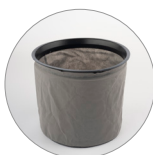
Vliesfilter (Polyester) waschbar (opt.)