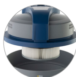
PTFE Kartuschenfilter (KLASSE M)