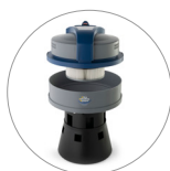
Ultra FilteRing System