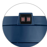
Einschalter (zwei motoren)