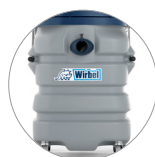
Behälter aus extrem widerstandsfähigem und schlagfestem Kunststoff