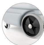
Schwenkräder und räder hinten mit großem Durchmesser