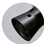
Korbfilterhalterung mit Schwimmer