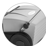
Praktisches System für eine schnelle Blockierung des Griffs