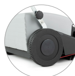
Hinterräder mit großem Durchmesser