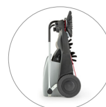
Kompakte Abmessungen: problemlos zum Aufbewahren