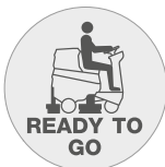
Funktion "Ready to go"