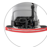
Kompakter Saugbalken mit natürliches gummi