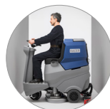
Kompakte Größe, wendig in allen Bereichen