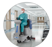
Funktion geräuscharmer Betrieb