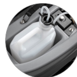
Chemical mixing system