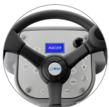
Bedienpult mit Display