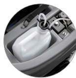
Chemical mixing system