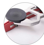
Saugbalken aus Aluminium