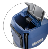
Schmutzwassertank: leicht zugänglich, leicht zu reinigen