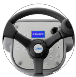
Bedienpult mit Display