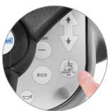
Funktion "Ready to go"