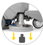
Extra Druck auf den Boden