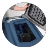
Sammelfilter für große Unreinheiten + Schutzfilter des Saugmotors