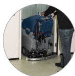
Einstellbarer und kompakter Saugbalken