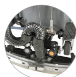
Einstellbarer und kompakter Saugbalken