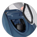
Sammelfilter für große Unreinheiten + Schutzfilter des Saugmotors