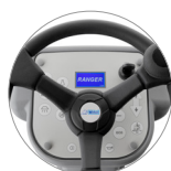
Bedienpult mit Display