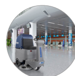
Große Betriebsautonomie, bis zu 7 Stunden (Ausführungen BC PLUS)