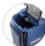
Schmutzwassertank: leicht zugänglich, leicht zu reinigen