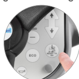
Funktion "Ready to go"