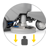
Extra Druck auf den Boden