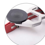
Saugbalken aus Aluminium